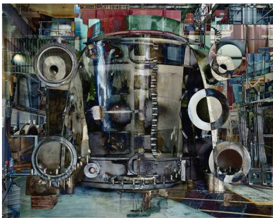
Série Melting Power - Usine Alstom - Belfort Photo n°2, 2009 C-print 180 x 230 cm