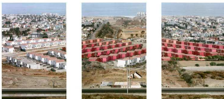
Série Landscaping - Tijuana - Playas - triptyque n° 1, 2002 ilfoflex 3 x (200 x 125) cm © Stéphane Couturier courtesy Galerie Polaris, Paris