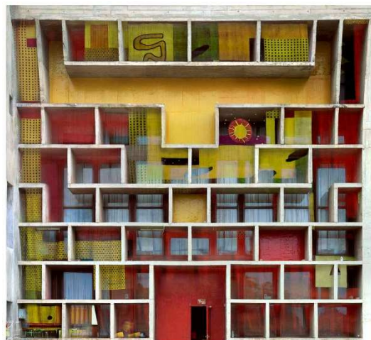
Série Chandigarh Replay - Chandigarh - Haute cour de justice n°1, 2006-2007 C-print, Ed. 3 180 x 198 cm