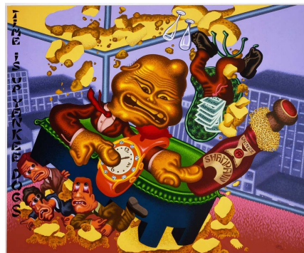
Chinese Businessman Lands on Wall Street, 2006, acrylique sur toile, 198 x 244 cm, photo : courtesy of David Nolan Gallery, New York

Né en 1934 à San Francisco, Californie, Peter Saul vit et travaille dans l'Etat de New York.