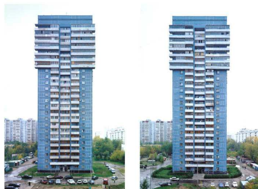
Série Monument(s) - Moscou – Monument n° 2 - diptyque, 1999-2001 ilfochrome, Ed. 5 2 x (200 x 125) cm