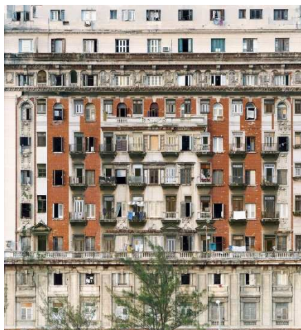
Série « Melting Point » - La Havane n° 4, 2007 C-print, Ed. 5 180 x 163 cm