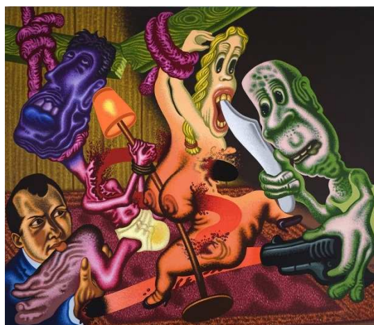
Beckmann's the night, 2009 acrylique sur toile 183 x 214 cm