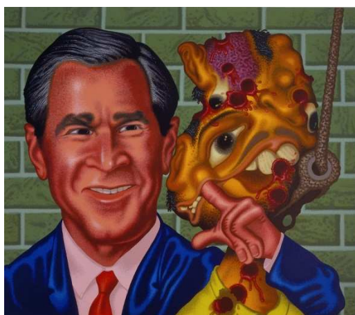
Bush at Abu Ghraib, 2006 acrylique sur toile 198 x 228 cm